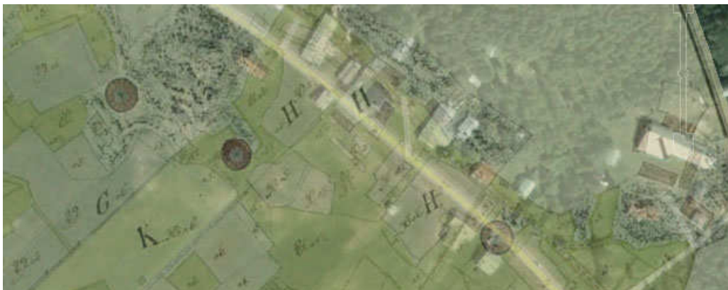
Skärmdump från Google Earth över en del av Ragvaldsträsk