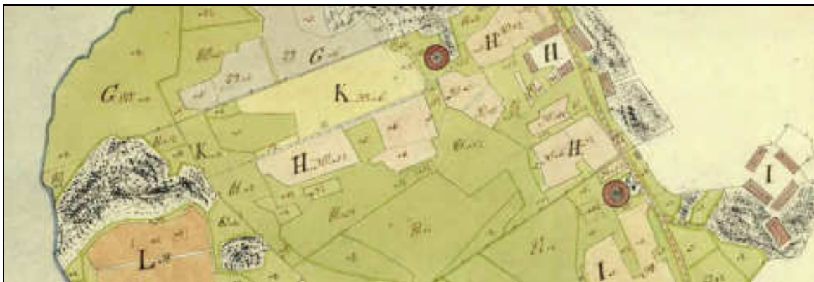
Utsnitt av storskifteskarta över Ragvaldsträsk från 1796

I lantmäteristyrelsen arkiv finns det en geometrisk avmätning från 1752 över Ragvaldsträsk 1-11. På den kartan kan man lokalisera platsen för Ragvaldsträsk 8. År 1796 var det storskifte i Ragvaldsträsk och ytterligare en karta upprättades. På den har Ragvaldsträsk 8, som nu blivit nr 9, fått littera I 10 . (Se bild här nedan.)