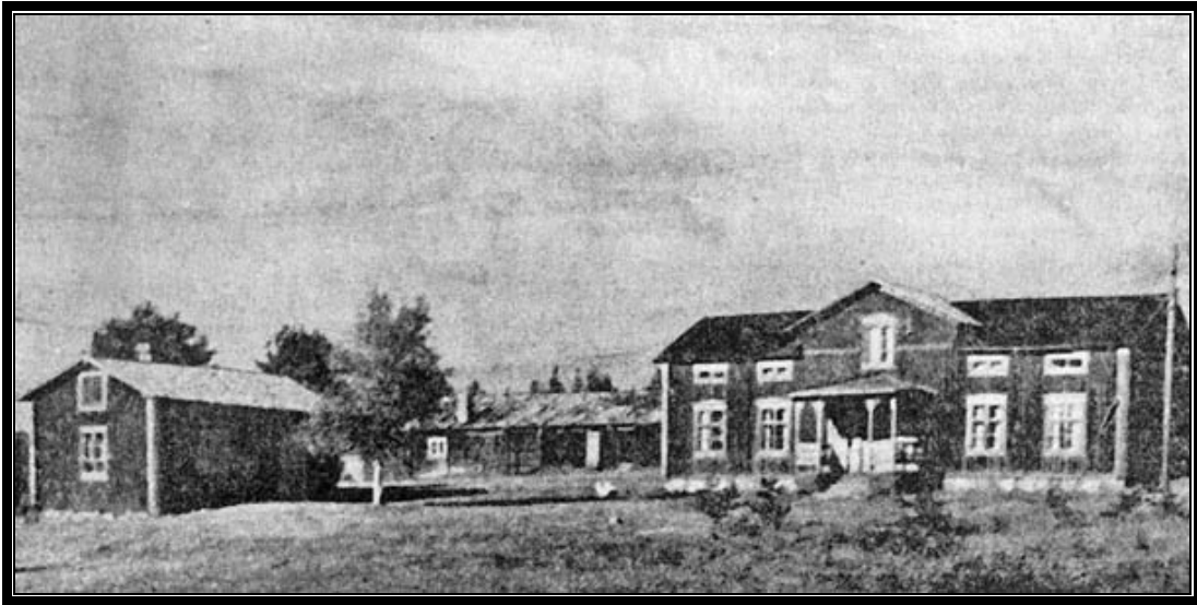
Jon-Annersa gården 1956