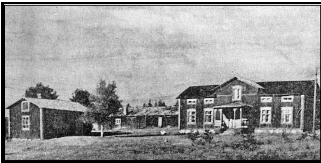
Jon-Annersa gården 1956